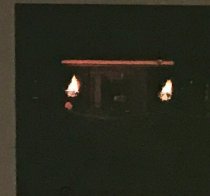
山の神の祭り (3 月) Yama-no-Kami Day of Prayer, Held Annually in March

Settled within the scenic foothills of holy Mt. Tateyama, these forested grounds within the Ashikura-ji area span 18,000m 2 (4.5 acres) and contain multiple Shinto buildings such as prayer halls and shrines. The Tateyama cedars of this pure forest reach towering heights of up to 50 meters (165 feet). Of the many trees, at least 122 have a trunk circumference of over 2 meters (6.5 feet), and some giants have trunks as thick as 6.6 meters (21 feet) around. The trees here are estimated to be between 400 and 500 years old, as evidenced by naturally felled trees with over 480 tree rings. These woods also contain so-called "marriage trees," where several cedars are conjoined at the trunk. This area acts as an incredibly valuable representation of the elegant Tateyama cedar. Nowhere else in the prefecture is there another forest with an assembly of such an impressive number of cedar trees.