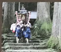
芦峯雄山神社神輿練り (7 月) 雄山神社の例大祭で行われる年中行事 Mikoshi Parade at Ashikura-Oyama Shrine, Held Annually in July

巨大なスギが林立する境内は、日本三霊山の一つとして古くから崇敬されてきた立山の祈願殿にふさわしい尊厳な雰囲気を漂わせています。江戸時代には、神聖な領域として加賀藩による禁制が敷かれ、境内林の伐採は厳しく禁止されていました。また、台風や積雪の被害があったときは芦峯寺の人々が補植を行い、スギ林を守ってきました。数百年の間、大切に守り継がれてきた境内杉林では、現在も多くの年中行事が執り行われ、立山信仰の伝統が息づいています。