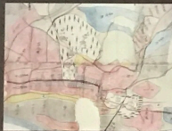
○芦峯寺高割山絵図 (部分) Ashikura-jii Area Boundary Map (Partial)